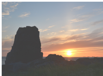
Midnattsolen, Nordlandshagen. Se våre web-sider

Vi har fått med oss at noen speidere fra Narvik ønsker å delta på vår Kretsleir i 2015, og i 2017 blir det et møte på Landsleiren i Bodø. I 2018 er speiderarbeidet i Kragerø 100 år, og 6. Narvik har allerede sagt ja til å være med på Kragerø speidergruppe's jubileumstur i 2018.